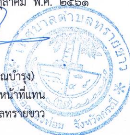
(นายสุทิน สุวรรณบำรุง) ปลัดเทศบาล ปฏิบัติหน้าที่แทน นายกเทศมนตรีตำบลทรายขาว